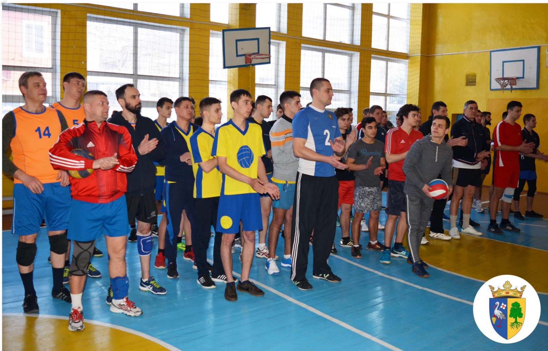
Locul IV în cadrul Cupei raionului Orhei la volei (8 echipe)